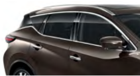
Серо-коричневый — CAM