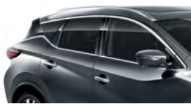
Темно-серый — KAD