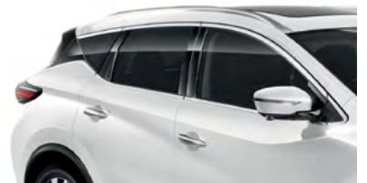
Белый перламутр — QAB