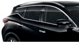
Черный — G41