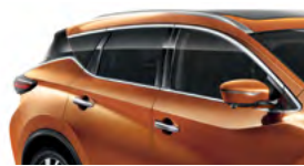
Оранжевый — EAW