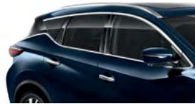
Темно-синий — RBG