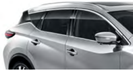
Серебристый — K23