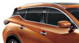
Оранжевый — EAW