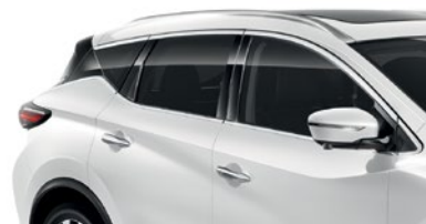
Белый перламутр — QAB