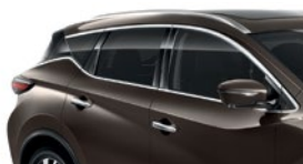
Серо-коричневый — CAM