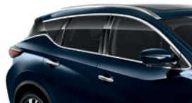
Темно-синий — RBG