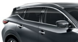
Темно-серый — KAD