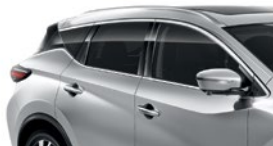
Серебристый — K23