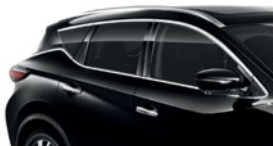
Черный — G41